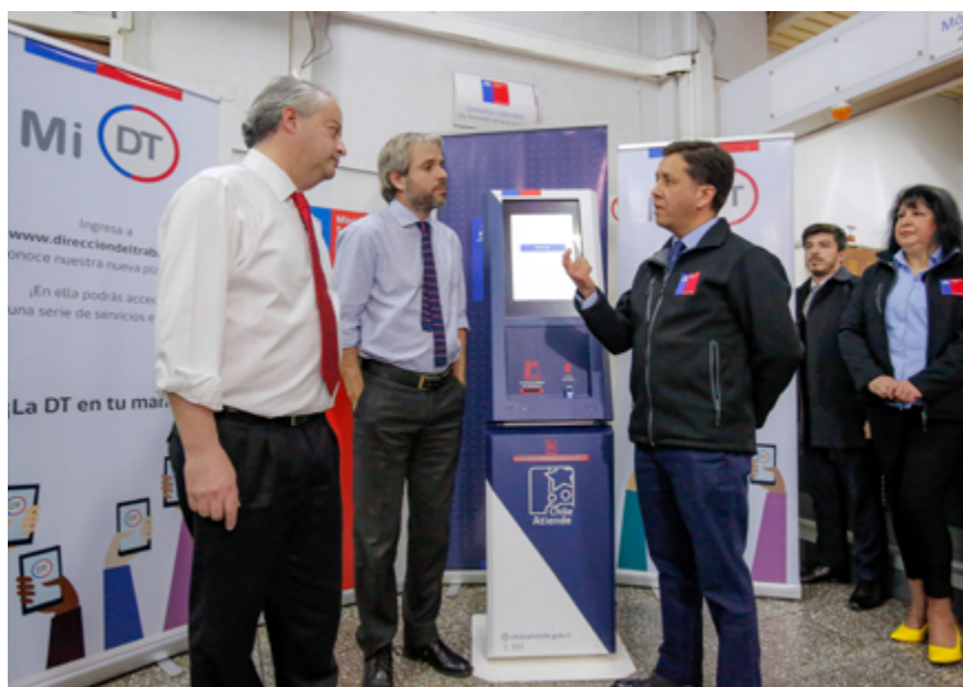
El director nacional del Trabajo (derecha) explica a los ministros Monckeberg y Blumel el funcionamiento de Mi DT durante la visita a la Inspección Provincial del Trabajo Santiago.

Ministro secretario general de la Presidencia invitó a los ciudadanos a obtener su Clave Única del Estado y destacó el nuevo portal donde se puede suscribir, por ejemplo, el contrato de trabajo electrónico.